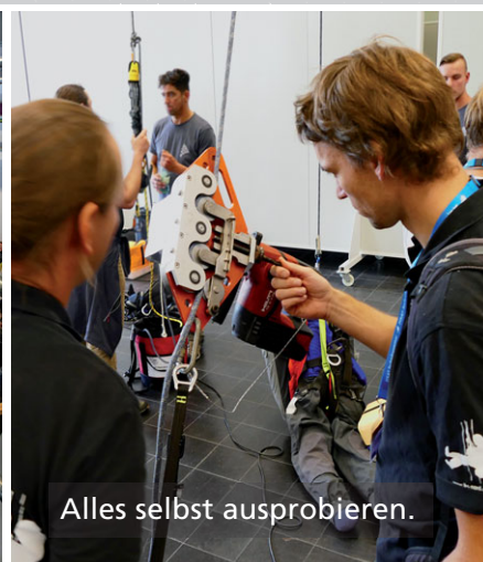
Alles selbst ausprobieren.