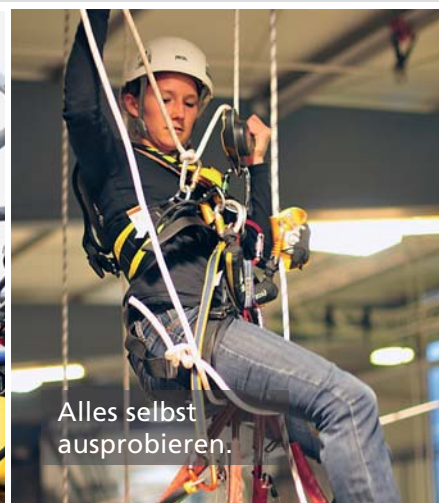
Alles selbst ausprobieren.